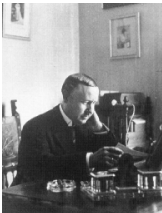
El maestro en su despacho.

bía del compositor, apenas que era de Lorca, que dirigió la Orquesta Nacional y que arregló e instrumentó la Marcha Real en una versión vigente hasta hace sólo unos años. Enseguida inicié los trámites para copiar los manuscritos y tras estudiarlos pronto me di cuenta que merecía la pena recuperar este repertorio. Tras buscar en Lorca, su ciudad natal, las bibliotecas madrileñas y sobre todo su legado en la Academia de Bellas Artes, conseguí reunir cinco obras dedicadas al clarinete. De ellas sólo una se publicó en su día, todas las demás estaban manuscritas. Eran piezas de sus años en Madrid, y todas tenían un denominador común: eran piezas de concurso, aunque el buen oficio del autor no ponía en ningún momento la dificultad técnica por encima del discurso musical., lo que justificaba aún más su recuperación.