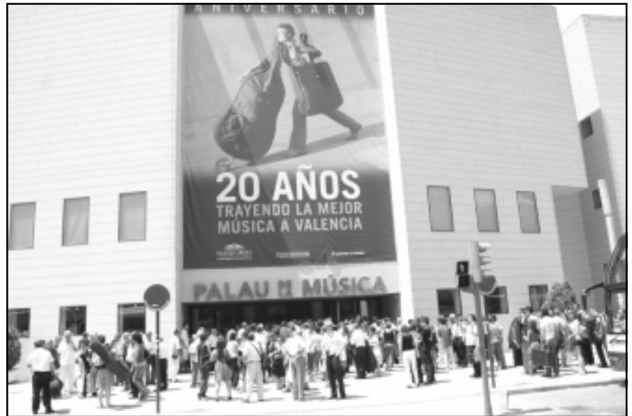
Entrada de los músicos de Yecla en el Palau de la Música de Valencia. 1 de julio de 2007.