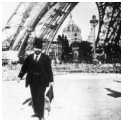
Bajo la recién construida Torre Eiffel.