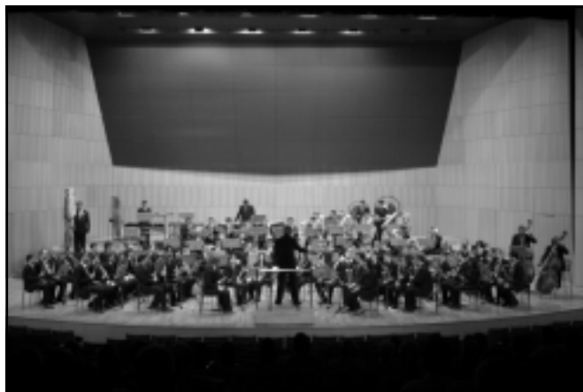
Concierto en el Auditorio de Murcia. 3-6-2007.