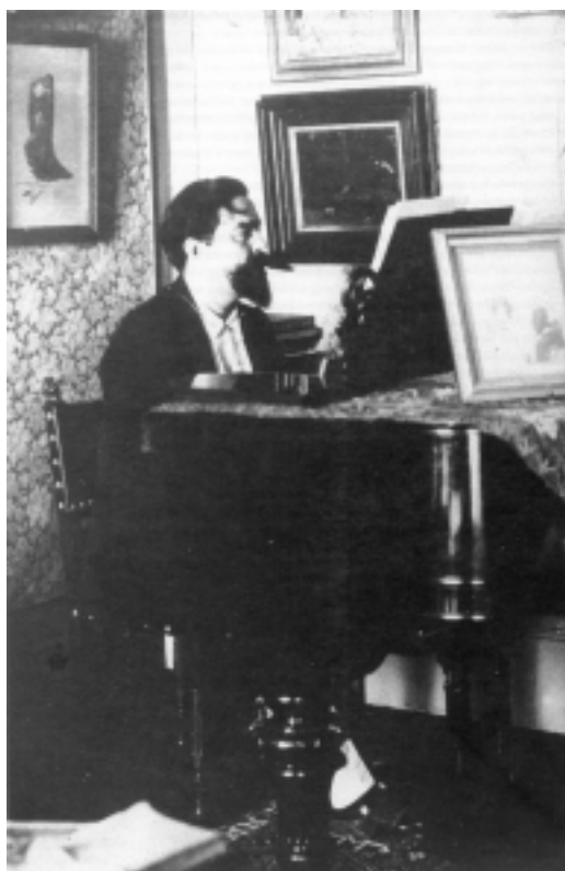
Tocando el piano.

y decide ir en su busca. No sabe con certeza donde está pero finalmente lo encuentra en Budapest. Esta visita marcaría sin duda un antes y un después en la personalidad de Albéniz. Tras conocerle decide cambiar de vida; intensifica sus lecturas, se hace profundamente religioso y en el terreno profesional decide reorientar su forma de componer, optando por desconocer u olvidar todo cuanto había escrito con anterioridad.