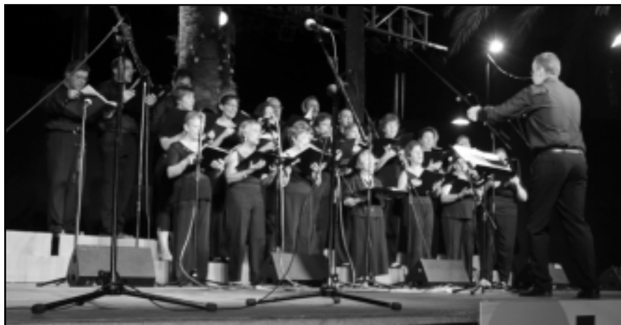
CORO "LA PURISIMA" DE LA ASO- Festival de Corales del Mar Menor, julio de 2006.