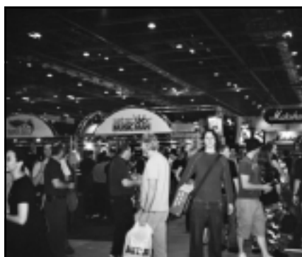
Entrada al recinto.

Profesor de Guitarra Eléctrica de la Escuela de Música de la Asociación de Amigos de la Música de Yecla