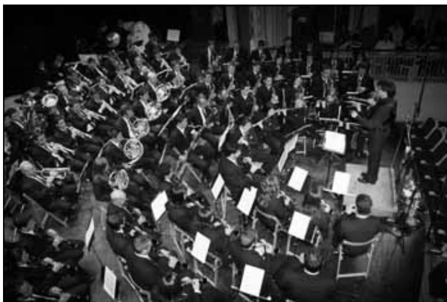
Concierto Santa Cecilia 2006.

Nuestra Asociación continúa un año más con sus objetivos de enseñanza musical, desarrollando actividades que favorezcan y difundan la cultura musical, a través de nuestra Escuela de Música, Coro polifónico y Banda de Música, ofreciendo conciertos y audiciones, en nuestra ciudad y fuera de ella, adquiriendo cada día más prestigio.