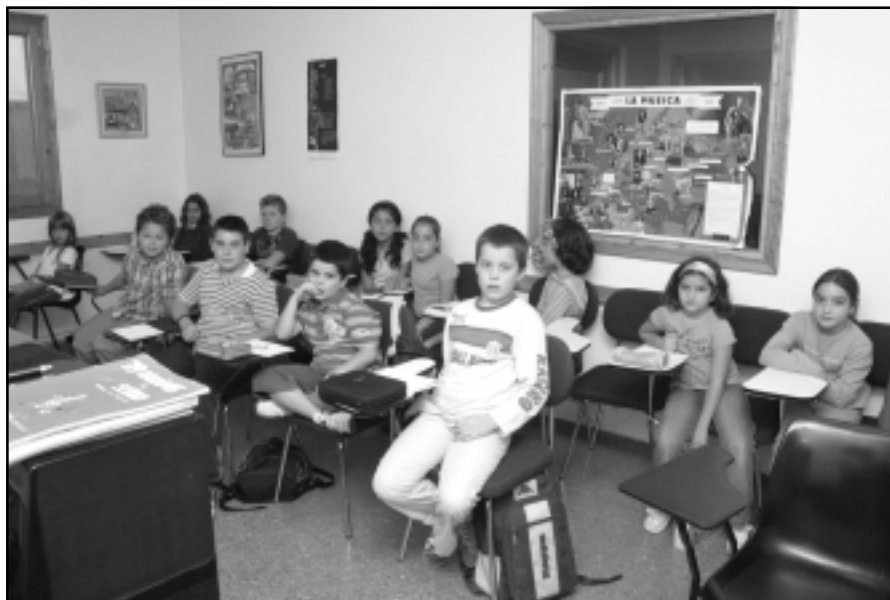
Alumnos de solfeo.

Igualmente me gustaría dejar claro que el estudiante de música tiene que realizar a la vez la educación primaria, la secundaria y el bachillerato, al