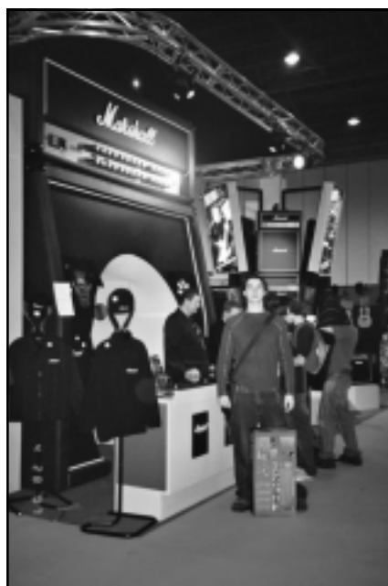
Stand de Marshall.

Continuamos la visita y nos detenemos en el stand de Peavey , ahí vemos lo que para mí es una joya de 120w de potencia a válvulas, el JSX , aclamado unánimemente por la crítica. Al probarlo