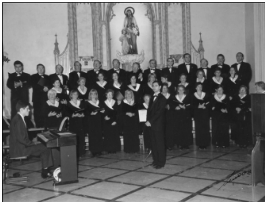
Como director del Coro «La Purísima».

Recuerdo que fue en la puerta de la Catedral, al aire libre. Y me imagino que un certamen se dirige igual con 20 que con 40 años. Es cierto que me acuerdo de que cuando terminamos y dieron los premios me quedé decepcionado, y eso que fue el segundo premio. Porque después de haber escuchado a