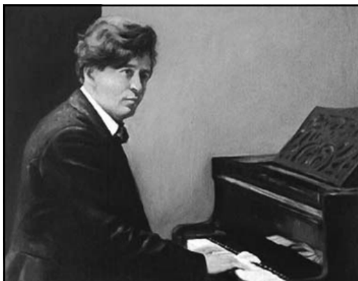
Busoni tocando el piano.

En 1907 Busoni publica su libro Entwurf einer neuen Ästhetik der Tonkunst (Ensayo de una nueva estética del arte musical) donde expresa sus avanzadas ideas sobre el lenguaje