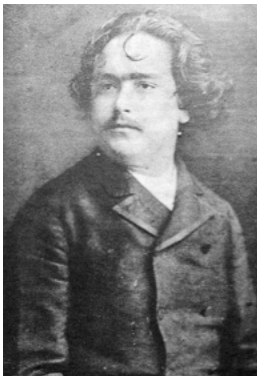
Isaac Albéniz en 1883.

Gracias al mecenazgo del conde, consigue estudiar en el Conservatorio de Bruselas con Gevaert y Brassin, quienes dan muestras del buen aprovechamiento del músico catalán. Pero ahora una nueva idea ronda a nuestro protagonista: conocer a Franz Liszt. Es el más famoso pianista de la época, reconocido en todo el mundo e idolatrado como una gran estrella. Isaac tiene veinte años