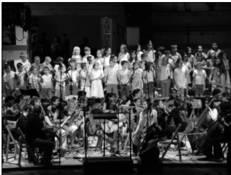
Concierto Fin de Curso 2006.

Día 25. Cena de Hermandad en el Restaurante Mundo Mediterráneo a la que asis-