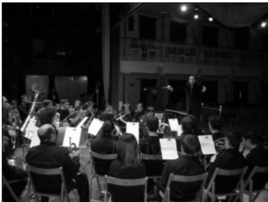
XXVII Ciclo de Conciertos Escolares, marzo 2006.

Día 23. Concierto de Navidad de la Escuela de Música celebrado en el Teatro Concha Segura, dentro del ciclo "Música en la Navidad" organizado por la Concejalía de Cultura del Ayuntamiento de Yecla, en el que actuaron la mayoría de los alumnos de nuestro centro educativo.