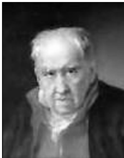
Juan Hidalgo de Polanco.

También puso música a diferentes textos de Calderón de la Barca, iniciándose esta cooperación en 1658 con "El laurel de Apolo", obra estrenada en Madrid el 4 de Marzo de