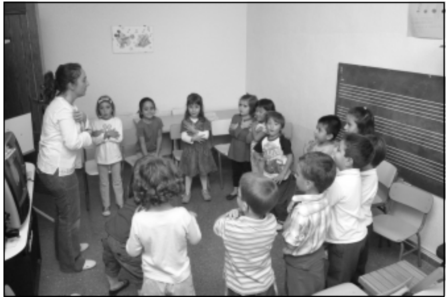
Alumnos de música y movimiento.