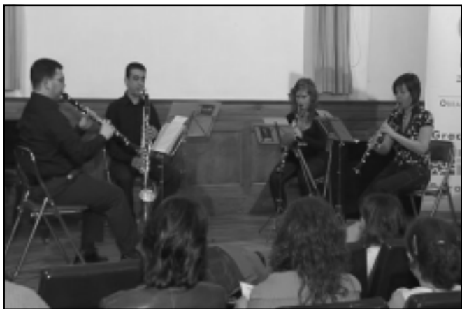
Concierto del cuarteto de clarinetes Clarinet Class. 26-4-2007.