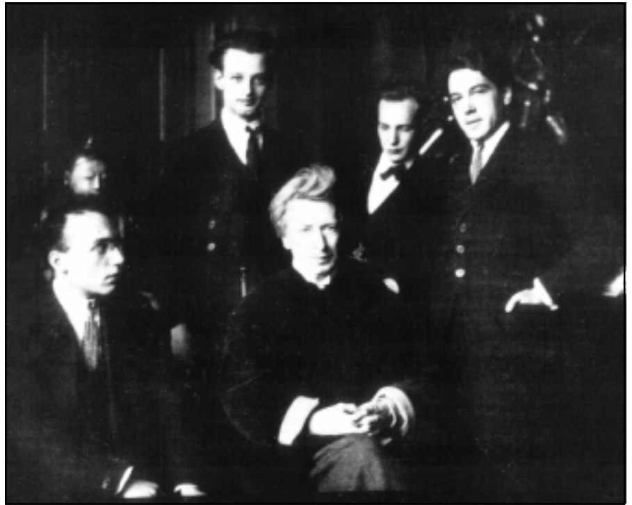
Ferruccio junto a varios de sus alumnos.

Las reflexiones estéticas de Busoni fueron el apoyo de la creación práctica, el fruto de un espíritu reflexivo que pretendía justificar el empleo del nuevo lenguaje musical que Busoni vislumbraba más que practicaba, puesto que el giro definitivo hacia