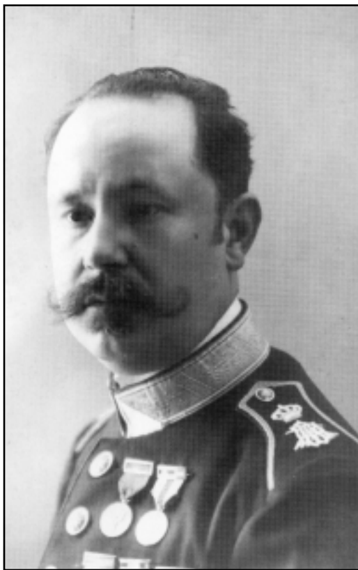
Bartolomé Pérez Casas.