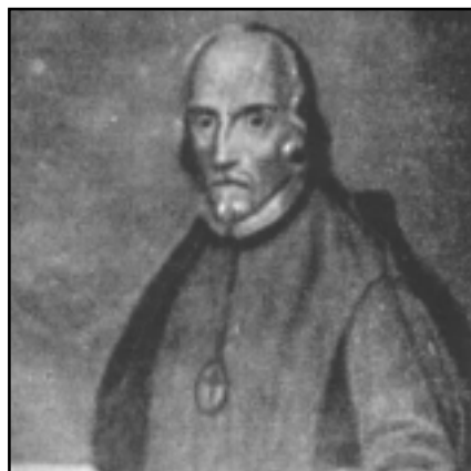
Calderón de la Barca.

1658, y que fue una de las primeras composiciones musicales que se denominaron con el nombre de zarzuela.