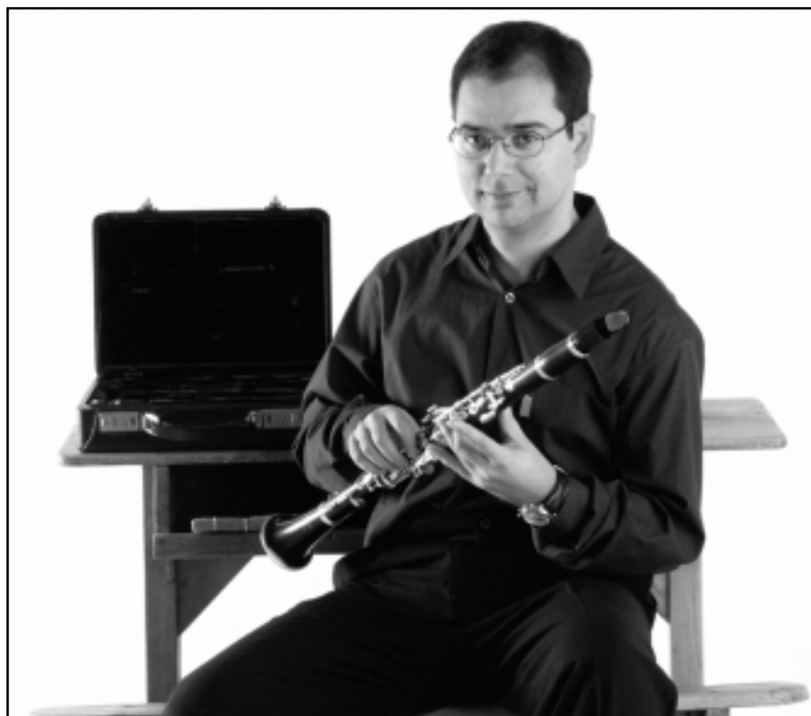
Con su instrumento, el clarinete.

“Me siento muy orgulloso de haber trabajado por la música en Yecla”