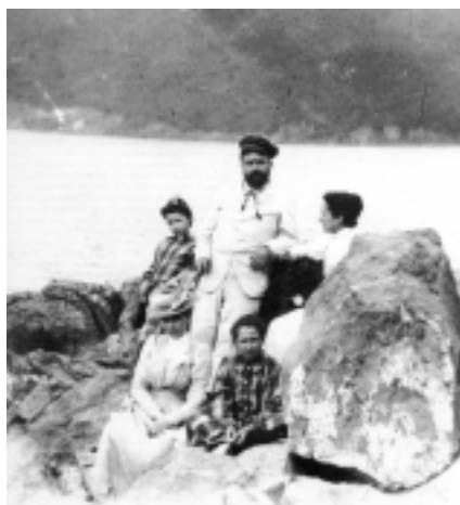
En la playa vizcaína de Chacharramendi con su familia, en 1898.

Ha muerto un gran artista -comentaba Bretón tras la muerte de su amigo- y a la par un hombre bueno. Aquél era más conocido que éste, y si grande era en una manifestación, en la otra era inmenso. Yo no he conocido un corazón más hermoso que el de Isaac Albéniz.