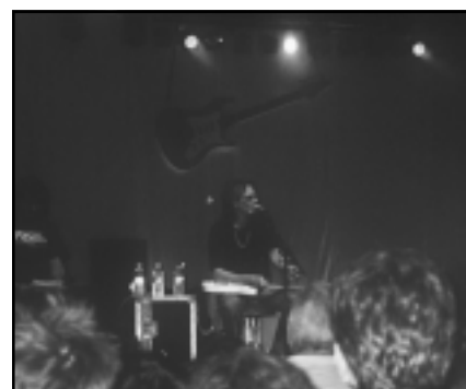
Master Class de Steve Vai.

También visitamos el stand de Gibson , TC Electronic conocidos por su G-force y G-major , presentando su nuevo G-system (me quedé sin hablar ante esta nueva súper pedalera preamp y efectos), visitamos también el stand de Ibanez con la nueva Ibanez 20 aniversario