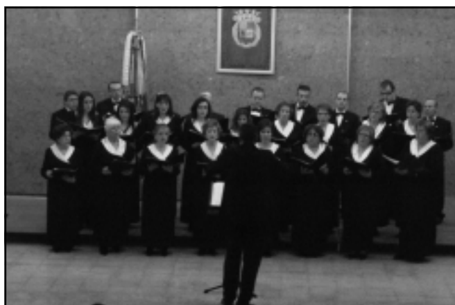
Coro «La Purísima» en el Festival de Vinalesa (Valencia). 31-3-2007.

23 de junio : Concierto Fin de Curso de la Escuela de Música, en la Plaza