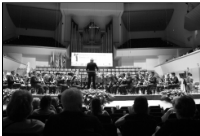
Certamen Internacional de Bandas «Ciudad de Valencia».